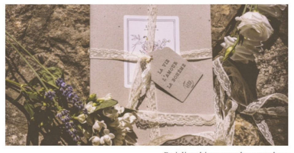
De jolis cahiers pour des mots doux

Mieux qu'un SMS ? Pour déclarer sa flamme, on choisira de coucher ses mots doux ou plus sensuels dans un joli cahier. En photo, le modèle « Amour » de « Love in St Rémy », une toute jeune marque d'objets déco et papeteries made in France. Couverture en papier 100 % recyclé, pages entièrement biodégradable et motifs floraux romantiques.